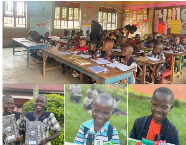
Schulstart an der Kids Care Primary School

An der Kids Care Primary School in Masaka freuten sich die Kinder auf den Schulstart und darauf ihre Freunde endlich wieder zu sehen.