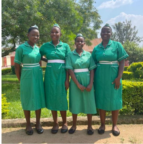
Auszubildende zu Krankenschwestern

Im Januar starteten unsere 4 Krankenschwestern ihr 5. und letztes Semester an der Keytume School!