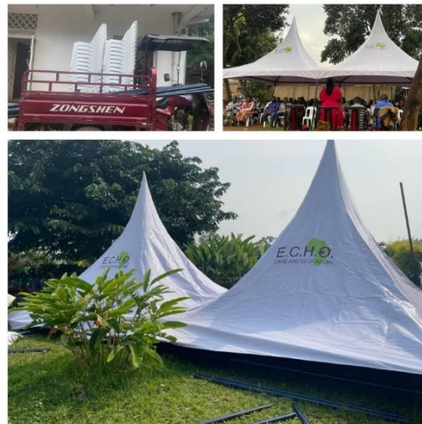
E.C.H.O Treffen mit neuem Zelt

Durch Spenden konnte E.C.H.O. ein Zelt sowie 200 Stühle kaufen. Dadurch fallen zukünftig keine Leihgebühren mehr an. Zudem sollen Zelt und Stühle auch vermietet werden und durch die Einnahmen Benzin für das E.C.H.O. Auto, kleinere Reparaturen und Ersatzteile finanziert werden. Im Januar gab es ein erstes Treffen mit den Familien und unseren betreuten Kinder von E.C.H.O..