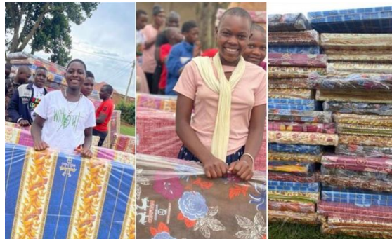
Absolventen der Primary School mit ihren Matratzen