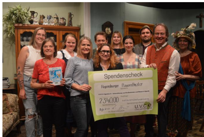
Bauerntheater - Spendenübergabe

Wir danken der Familie Kirner für ihre fantastische Unterstützung in den vergangenen Jahren und die tolle Werbung für U.V.C.O. im Bauerntheater. Ein großes Dankeschön auch an all die lieben Spender!