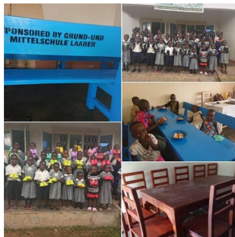
Nähschule EYMCBO mit ihren Anschaffungen

Durch die großartige Spende der Grund- und Mittelschule Laaber konnten an der Nähschule EYMCBO Holztische, Bänke und Stühle für Kinder und Erwachsene beschafft werden. Zudem erhielten die Schulkinder schwarze Schuhe für die Schule und Crocs für die Freizeit.