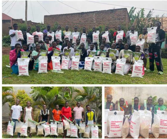
Übergabe der Weihnachtspakete

Durch Spenden konnte E.C.H.O. ein Zelt sowie 200 Stühle kaufen. Dadurch fallen zukünftig keine Leihgebühren mehr an. Zudem sollen Zelt und Stühle auch vermietet werden und durch die Einnahmen Benzin für das E.C.H.O. Auto, kleinere Reparaturen und Ersatzteile finanziert werden. Im Januar gab es ein erstes Treffen mit den Familien und unseren betreuten Kinder von E.C.H.O..