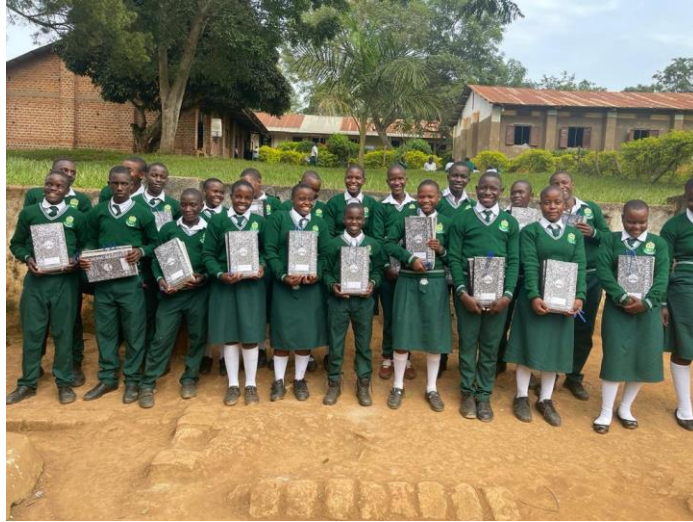
Patenkinder an der Secondary School St. Anthony

An der Secondary School St. Anthony starteten 23 Patenkinder im Februar mit der S.1.