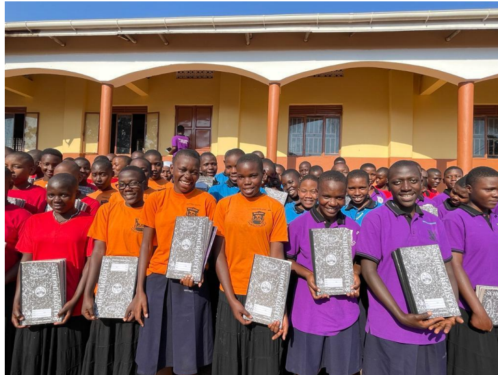
Schulstart am Buloba College

Auch am Buloba College wurde der Schulbetrieb mit 118 Kindern wieder aufgenommen, darunter 20 Erstklässler.