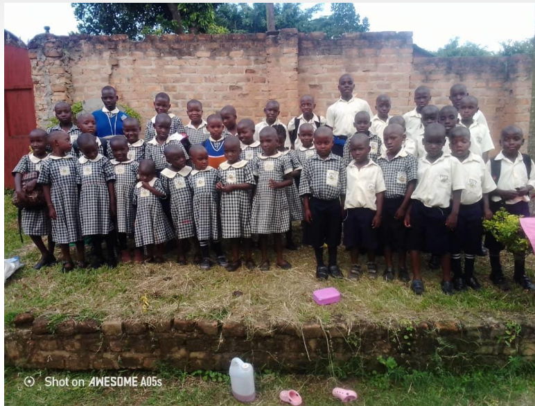
Kinder an der Hand in Hand School in Mityana

Wir wünschen allen Kindern viel Spaß und alles Gute im neuen Schuljahr. An dieser Stelle auch noch mal ein großes Dankeschön an alle Paten, die dies ermöglichen!